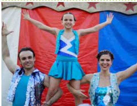
Curtas-metragens / 64'

Na 1ª edição do PLAY contamos já com uma parceria com o FICI- 11º Festival Internacional de Cinema Infantil. Assim, a programação do PLAY conta com uma seleção de sete filmes brasileiros, produzidos nos últimos três anos e exibidos no FICI, uma longa-metragem e seis curtas. A exibição destes filmes pretende aproximar culturas, sublinhando a grande vantagem de uma língua comum, expondo os espectadores ao que de melhor e mais recente se produz no Brasil.